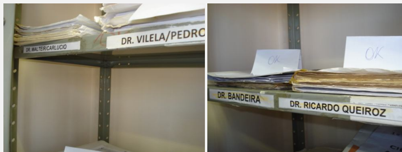
Fotos da Identificação dos Advogados na Secretaria

- Importante destacar que foram apresentados 170(cento e setenta) autos de processos da Infância e Juventude, dos quais, através da amostragem de 15 (quinze) processos - maioria Ato Infracional - ficou patente a demora na tramitação, ou seja, a não observância da prioridade devida aos feitos desta natureza.