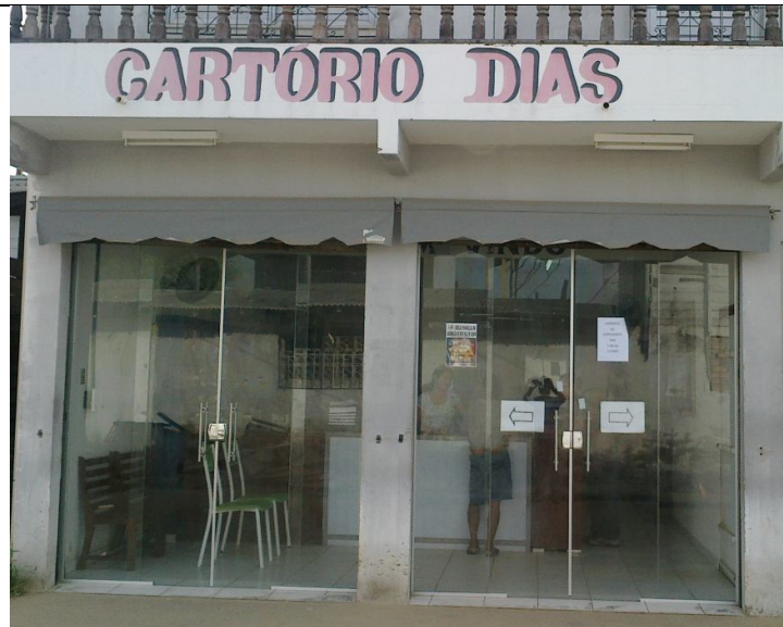
Fachada do Cartório

O horário de funcionamento do Cartório é das 7h às 13h.